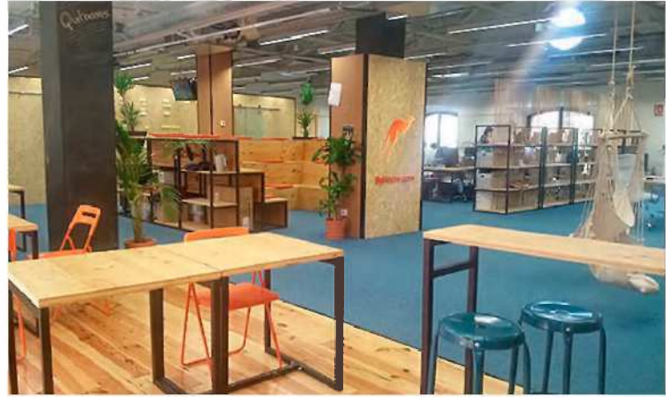
Los espacios diáfanos buscan impulsar la creatividad y el intercambio de ideas y experiencias. EE

amplio espacio de co-office del propio proyecto. Desde los inicios de las empresas tecnológicas, como Terra y Ozú, pasando por los esfuerzos de instituciones como Barcelona Activa e iniciativas como el 22@, se habían puesto ya unas bases sólidas. Pero fue un encuentro entre el anterior alcalde, Xavier Trias, y Miguel Vicente el que aportó el espaldarazo final.